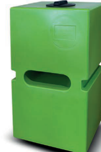
KWT 450V stehend / 450 l