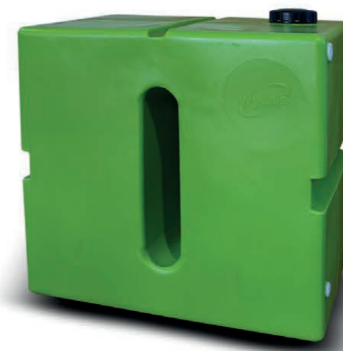
KWT 500/650/800 500 l, 650 l oder 800 l