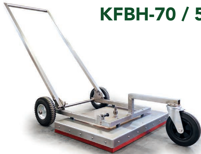
KFBH-70 / 50