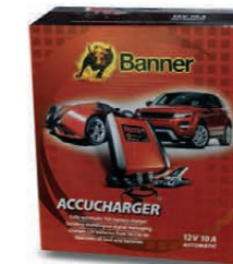
Im Set: KBL12V