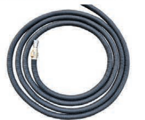
Spezierschlauch 20 m