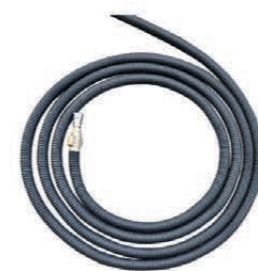
KHHS - 5/10/15/20

Schlauchaufroller automatisch oder manuell