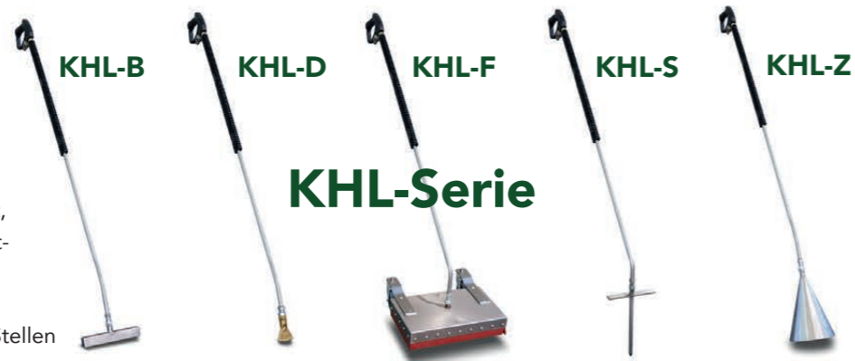
Auch im Set erhältlich: KHL-Set (B-D-F)