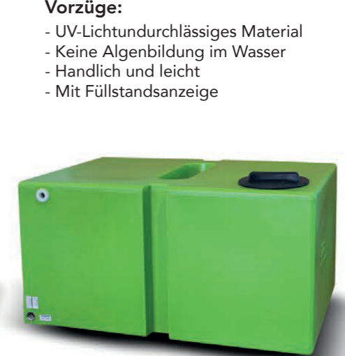
KWT 450H liegend / 450 l